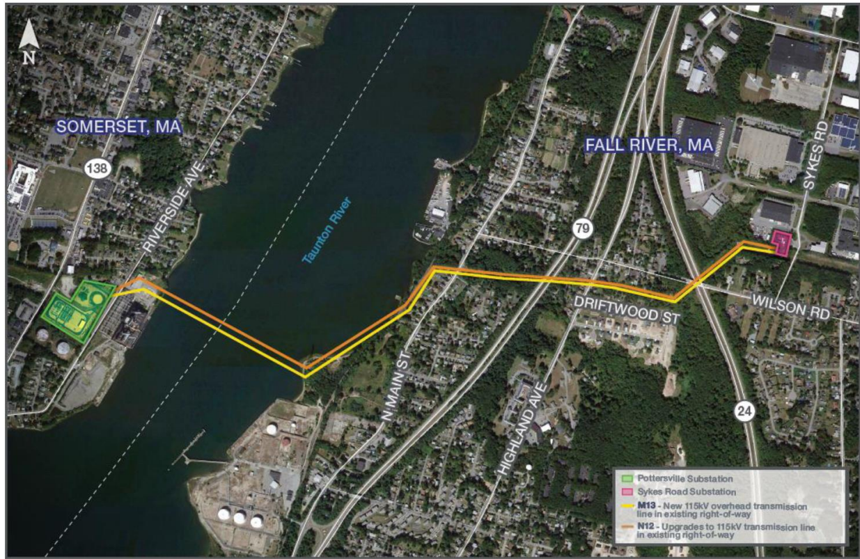
Figura 1: O Projeto